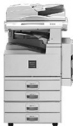
Fig.1 imagio Neo 450 モデル 75

認証取得にあたっては、imagio Neo 350/450 シリーズを単なるコピー機ではなく様々な脅威にさらされているネットワーク機器ととらえた上で、セキュリティの観点から分析を行った。具体的には、まず製品が使用される環境を想定、保護資産とそれに対するセキュリティ脅威を定義し、必要なセキュリティ機能を明確にして「セキュリティターゲット」と呼ばれる文書にまとめる作業を行った。さらに実際の評価作業では、仕様書や設計書およびマニュアルといった文書の検査のほか、実機テストや開発現場の監査等、様々な観点からの評価が行われ、ユーザが安心して使用できる製品として世に送り出した。