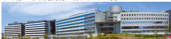
Fig.1 ドコモ R&D センタ全景

横須賀リサーチパークに位置するドコモ R&D センタは、1998 年 3 月のオープン以来、モバイルマルチメディアの実現に向けた研究開発が進められており、ドコモの新技术・新サービス等の研究開発を行う中心拠点である。より自由なテレコミュニケーションを提供し新たなモバイル文化を創造するため、「サービス」、「ネットワークインフラ」、「デバイス」を 3 つの柱として様々な研究開発が行われている。